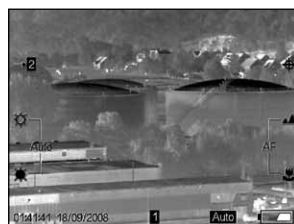
Zivil- und Katastrophenschutz