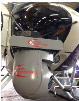
Helicopter mit montierter VarioCAM® High Definition im Gimbal

Bei der Integration der Kamera in den Gimbal und sukzessive an den Hubschrauber wurde swiss controlling umfassend von den Spezialisten von InfraTec beraten und unterstützt. So wurde beispielsweise ein optimiertes Bedieninterface entwickelt, das es dem Inspekteur im Cockpit erlaubt, die Kamera direkt per Joystick zu steuern. Ebenso lassen sich von dort gezielt Thermografiebilder aufzeichnen und andere Geräte, wie z. B. eine visuelle Kamera, handhaben. Die voll radiometrischen thermografischen Messdaten können zusammen mit GPS-Koordinaten und anderen Informationen, wie einem visuellem Bild, der jeweiligen Mastnummer und einem präzisen Zeitstempel, einzeln oder als Sequenz abgespeichert werden.